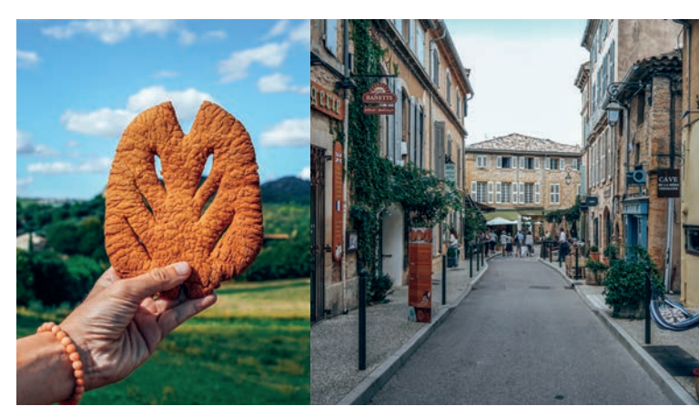
I GIBASSIER I PLACE DE L'ORMEAU

RENSEIGNEMENTS DANS VOTRE OFFICE DE TOURISME : 04 90 71 32 01 / 04 90 72 02 75 / 04 90 68 10 77