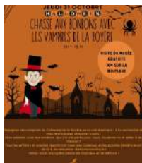
©Affiche Halloween Royère