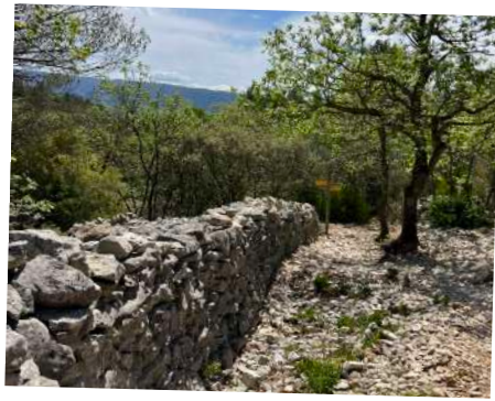
Mur de la peste