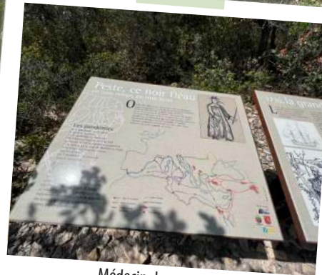
Médecin de peste

Depuis 1986, une campagne de restauration et de valorisation est en place par l'intermédiaire de l'association « Pierre sèche en Vaucluse ». Près de 6 kilomètres de muraille ont été restaurés , avec la dernière section dégagée située aux Taillades . Le mur est maintenant inscrit au titre des Monuments historiques et permet de mettre en lumière un épisode important de l' histoire vauclusienne .