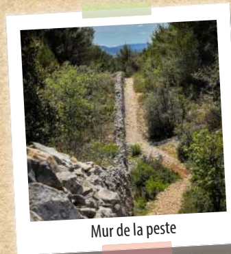
Mur de la peste