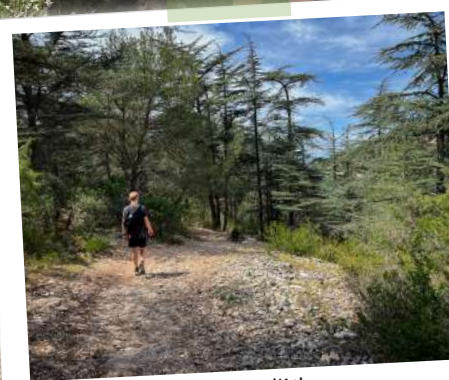
Cèdres de l'Atlas

En août 1989 , un incendie a ravagé 338 hectares de forêt sur Cabrières d'Avignon et Fontaine-de-Vaucluse , mais la plupart des cèdres ont résisté. Quelques-uns des spécimens venant de l' Atlas algérien portent encore les cicatrices de l'incendie , tandis que d'autres ont été replantés en 1991 .