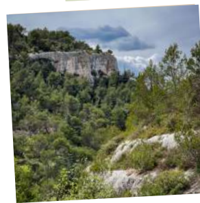
Point de vue