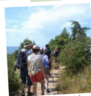
Randonnée autour du mur de la peste