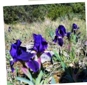
Iris nains sauvages