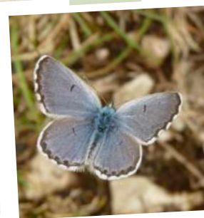
Azuré du Thym