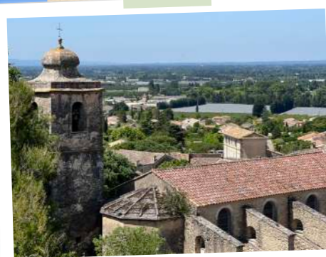
Clocher à bulbe de l'église