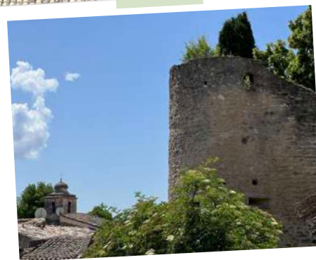
Tour Nord du Château de Lagnes

Les remparts débutaient au pied Est du château , passaient près de la tour de l'horloge et suivaient le tracé des rues allant de nos jours au cimetière .