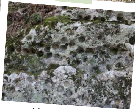
Dalle à Empreintes d'oursins

Vous découvrirez également des anciennes terrasses de culture , des vestiges de murs de pierre sèche et des zones anciennement pâturées, témoins de l'agriculture autrefois pratiquée dans la région. Enfin, ne manquez pas la vue imprenable sur les contreforts du Luberon et les dentelles de Montmirail .