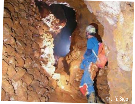
Exploration de la Mine du Pieï