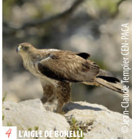
4 L'AIGLE DE BONELLI