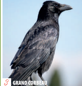
3 GRAND CORBEAU